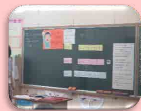
自立活動（話し合い）