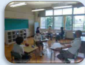
自立活動（ソーシャルスキルトレーニング）