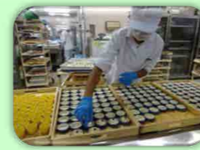
産業現場等における実習

教育課程は、高等学校の普通科文系に近い教科配列です。職業教育も取り入れています。